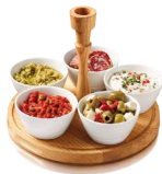
CHIP & DIP SETS